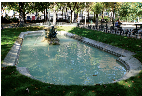
Square Emile Chautemps. Basen północny.

-Granitowa kolumna upamiętniający francuskie zwycięstwa w wojnie krymskiej (Bitwa pod Inkermanem - 5 listopada 1854 roku; Oblężenie Sewastopola (1854–1855); Bitwa nad Almą - 20 września 1854; Bitwa Tcherņa - 16 sierpnia 1855).