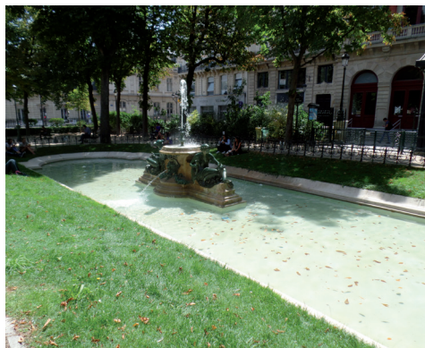
Square Emile Chautemps. Basen południowy.