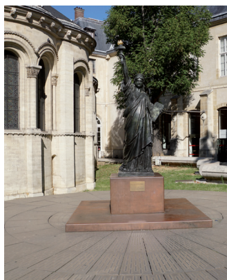
Statua Wolności na Square du Général Morin.

Na dziedzińcu, przed wejściem stoją 2 pomniki: statua wolności i pomnik Zenobe Gramme, belgijskiego elektrotechnika, który w 1869 roku wynalazł komutator, przyczyniając się do rozwoju maszyn elektrycznych i prądu stałego. W 1871 roku zbudował pierwszą prądnicę prądu stałego, zwaną od jego nazwiska prądnicą Gramme’a.