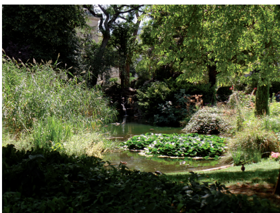
Square du Temple. Cascade du square du Temple.

Youtube: www.youtube.com/watch?v=ZptZ-cvaIMss