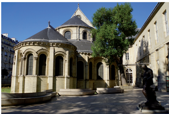
Pomnik Zenobe Gramme oraz Saint Martin des Champs na Square du Général Morin.