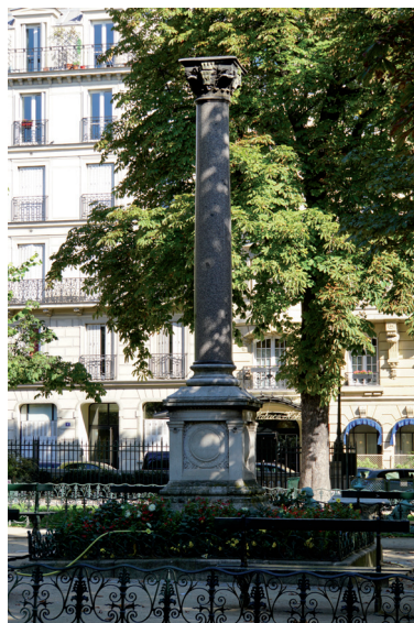
Square Emile Chautemps. Kolumna.

Youtube: www.youtube.com/watch?v=snx_f7ILKOk