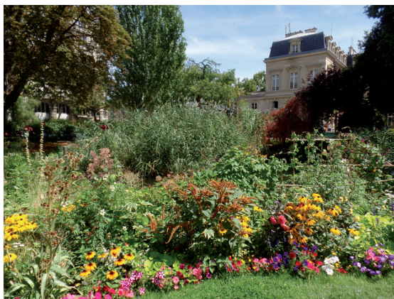
Square du Temple. Cascade du square du Temple.