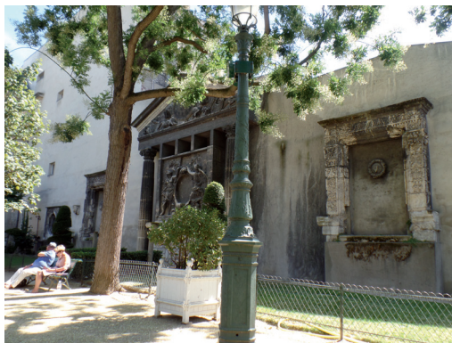
Square Georges Caïn. Fronton i kolumny Palais des Tuileries otaczające płaskorzeźbę.