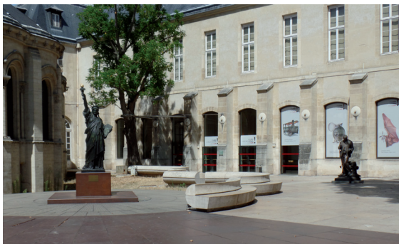
Square du Général Morin i wejście do Musée Arts et Métiers.