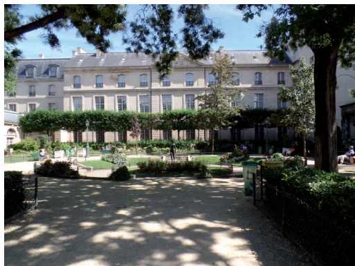
Square Georges Caïn. Po środku posąg „Świt”.