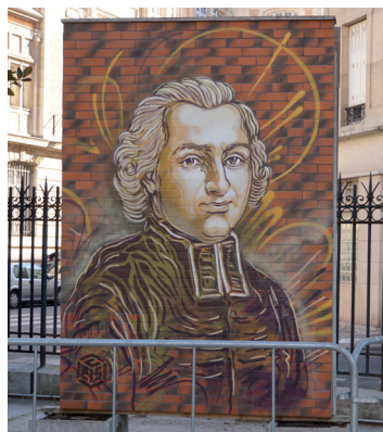
Wystawa na Square du Général Morin.