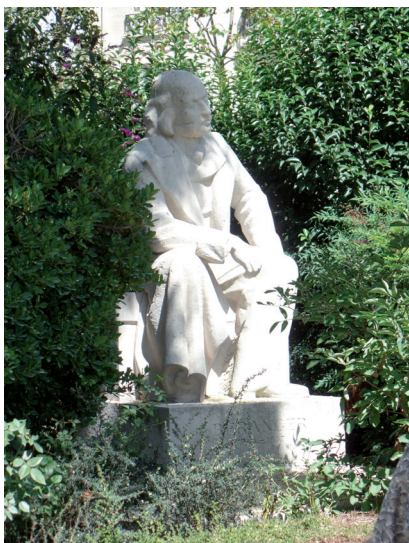
Square du Temple. Pierre-Jean de Béranger.