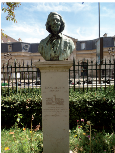
Square Emile Chautemps. Popiersie Marca Seguina. Widok na Conservatoire National des Arts et Métiers.