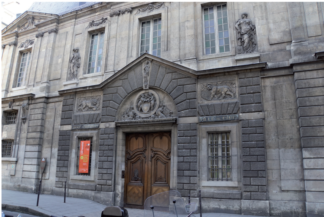
Hôtel Carnavalet. Wejście od rue de Sévigné.

Godziny otwarcia: od wtorku do niedzieli w godzinach od 10 do 18. Ostatnie wejście o godzinie 17.30.