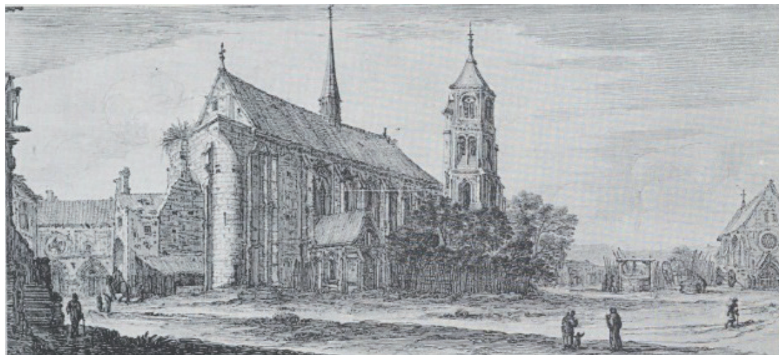
Église Saint-Martin des Champs. i jedna z kaplic, a także różne budynki klauzury klasztornej widziane przez Israela Silvestre'a w XVI wieku. Wiek XVIII i XIX znacznie zmieni jego wygląd.